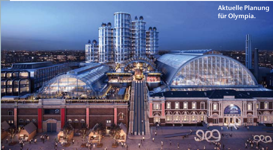
Aktuelle Planung für Olympia.

Deutschen Finance dar: Die geographische Diversifikation ist breit, dabei wird ein Fokus auf Länder gelegt, in welchen die Deutsche Finance selbst präsent ist. Die thematische Diversifikation ergibt sehr unterschiedliche Einnahmearten bei Haltezeiten, die von sehr kurz- bis mittelfristiger Dauer sein sollten. Unter dem Strich entsteht damit ein sehr gutes Chancen-Risiken-Verhältnis, dank der unterschiedlichen Liquiditätsströme und der sehr divergenten Marktnischen, die einander ergänzen, aber nicht korrelieren.