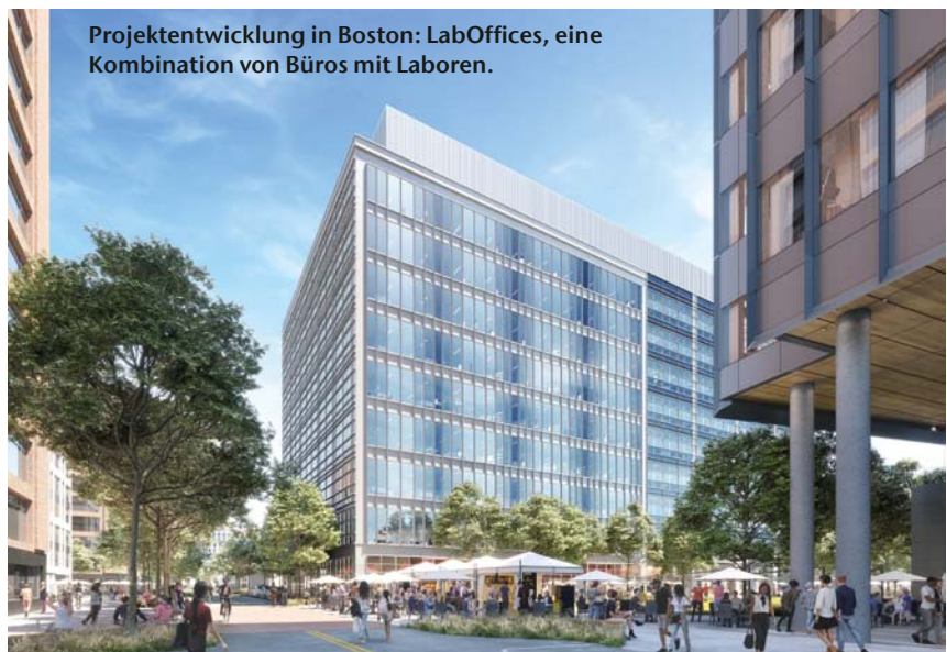
Projektentwicklung in Boston: LabOffices, eine Kombination von Büros mit Laboren.

Sämtliche Investmentfonds der DF-Gruppe investieren ausschließlich in institutionelle Investmentstrategien von sogenannten „Private Market Managern“ (also Anbietern, die ausschließlich im geschlossenen Kundenkreis agieren). Dafür hat die Deutsche Finance eine sogenannte Investment-Plattform etabliert, ein Netzwerk, über welches Investments akquiriert und über eigene Fachleute gemanagt werden. Im Rahmen der Investment-Plattform sind eigene erfahrene Experten vor Ort aktiv, um mögliche Zielinvestments möglichst fundiert selektieren und laufend verwalten